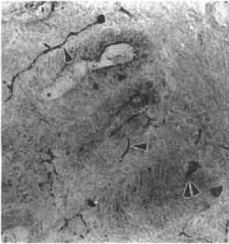
图2 显示分布在大鼠胃幽门固有膜内的 CGRP 阳性神经纤维(「)和少量的 CGRP 阳性细胞(||),ABC 免疫组织化学方法,×400